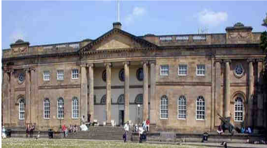
York Castle Museum